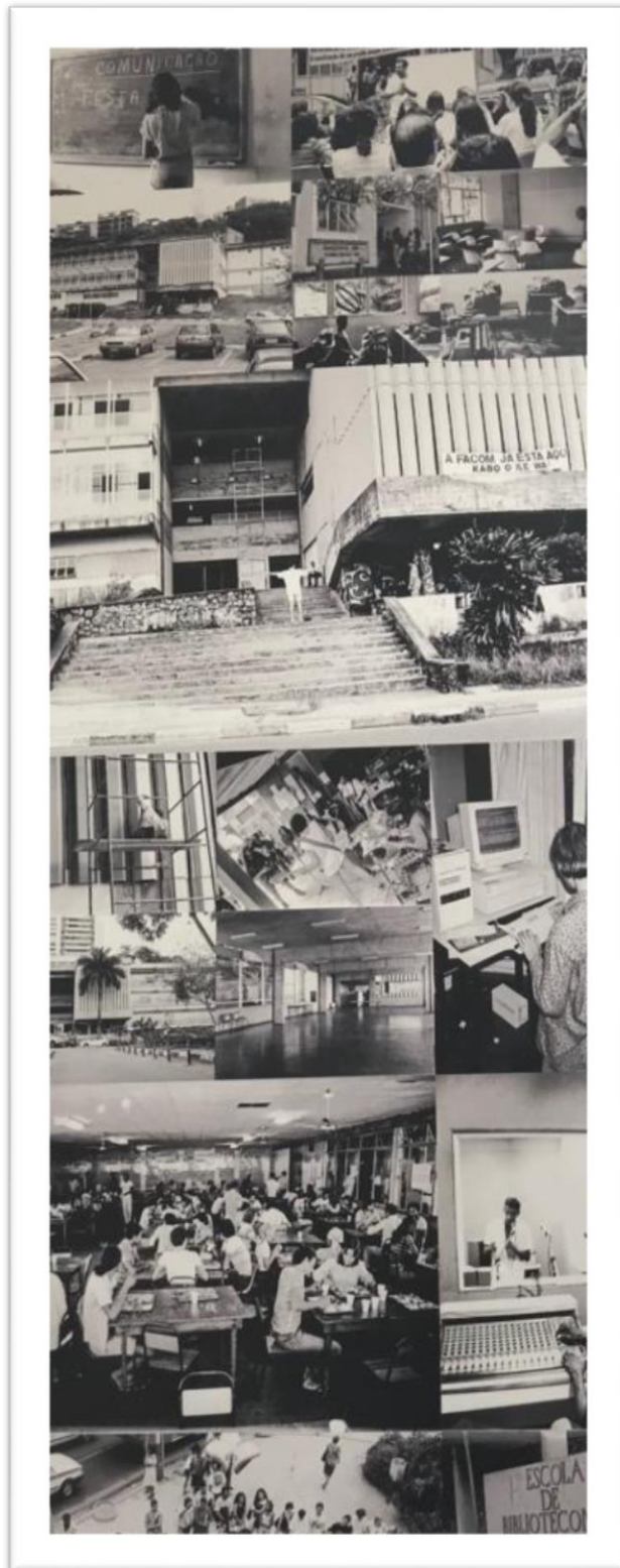
Painel fotográfico plotado na Sala da Direção na Sala da Secretaria da Direção