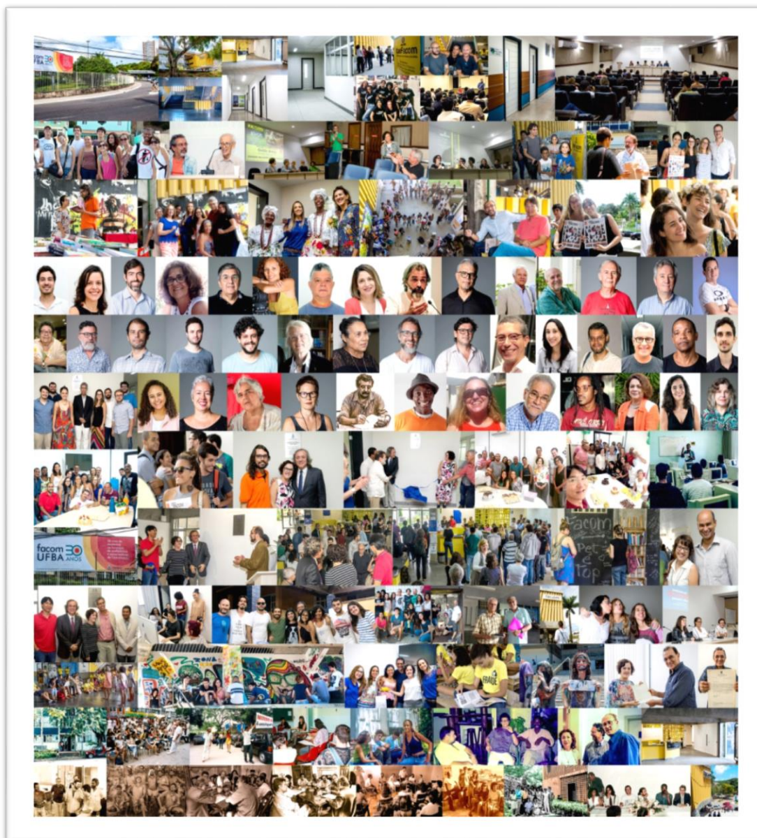
Painel fotográfico plotado na Sala da Secretaria da Direção