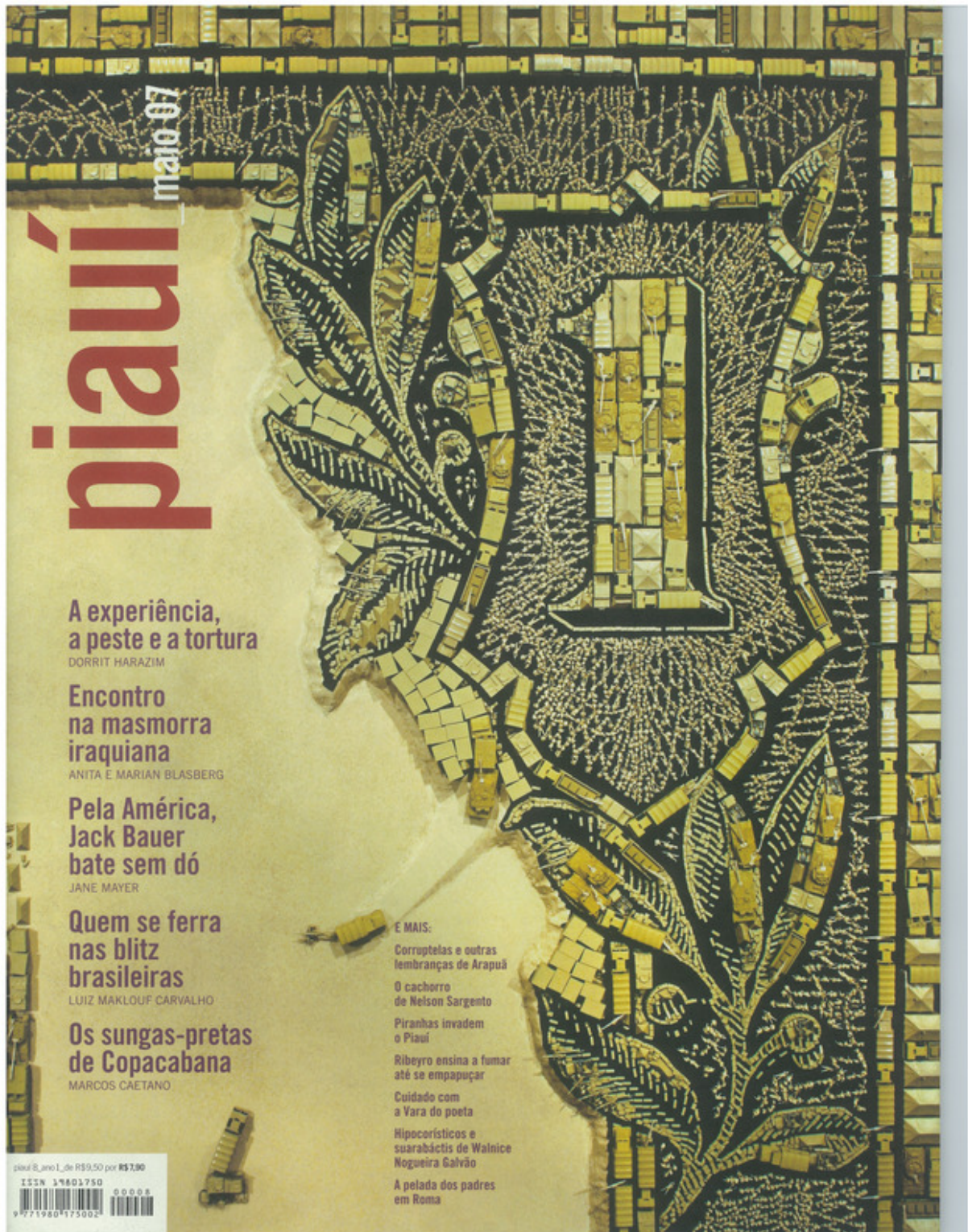
Figura A.8: capa da revista piauí de maio de 2007