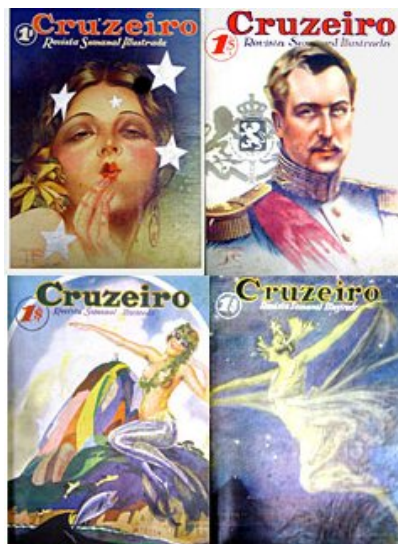
Figura 4.1: capas da quatro primeiras edições da revista O Cruzeiro

Até o início da década de 50, Nasser e Manzon fizeram reportagens que se tornaram clássicas, como Enfrentando os Chavantes (sic), registro do primeiro contato da tribo indígena com o o homem branco. Manzon desfez a dupla quando foi trabalhar na recém-lançada concorrente no segmento das ilustradas, a Manchete de Adolpho Bloch, mas isso não diminuiu o fôlego de reportagens da equipe de Chatô – em alguns meses, ele chegava a mandar mais de 30 repórteres para diversos lugares do Brasil, em busca de boas histórias.