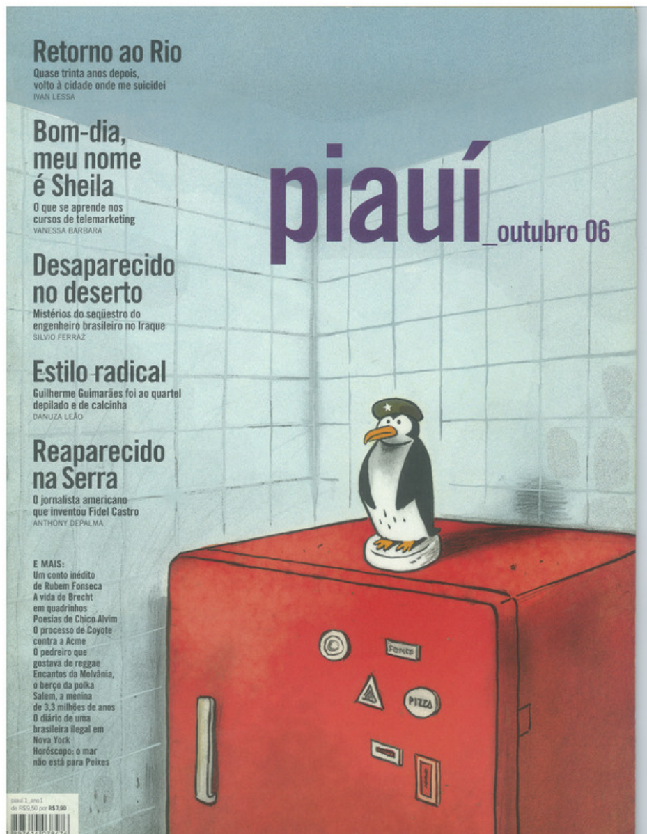
Figura A.1: capa da revista piauí de outubro de 2006