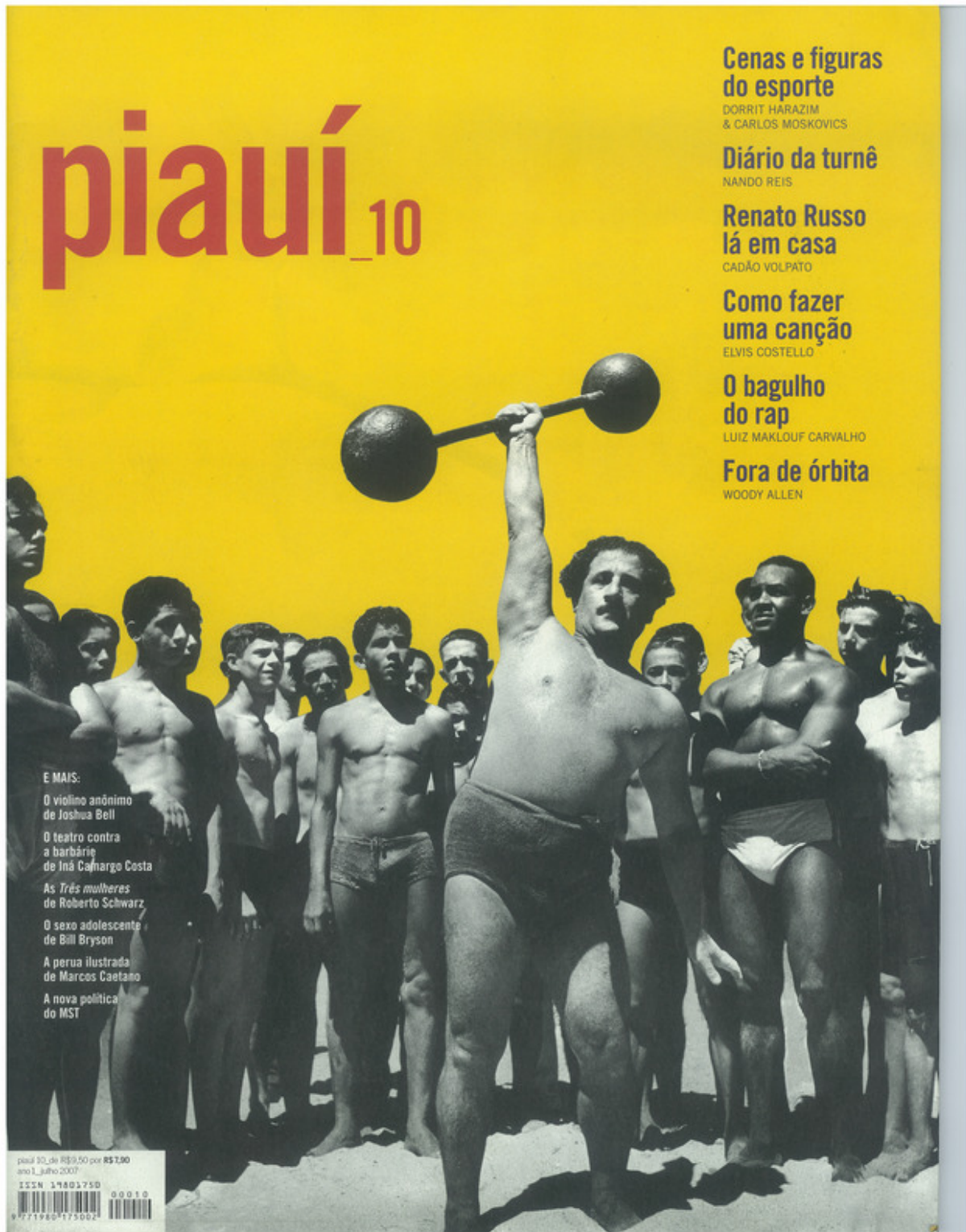
Figura A.10: capa da revista piauí de julho de 2007