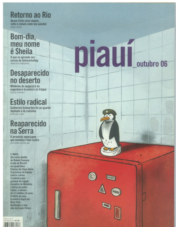
Figura 5.1: capa da revista piauí de outubro de 2006

A primeira edição de piauí (Figura 5.1) desafiava essa identificação instantânea, com uma ilustração: um pingüim de boina sobre uma geladeira vermelha. À esquerda, cinco chamadas grandes: “Retorno ao Rio”, “Bom-dia, meu nome é Sheila”, “Desaparecido no deserto”, “Estilo radical” e “Reaparecido na Serra” – todas acompanhadas de uma frase explicativa, em fonte menor, e o nome do autor. Nenhuma delas, portanto, tem qualquer relação com o pingüim, ou possibilitam a definição de gênero imediata para o leitor.