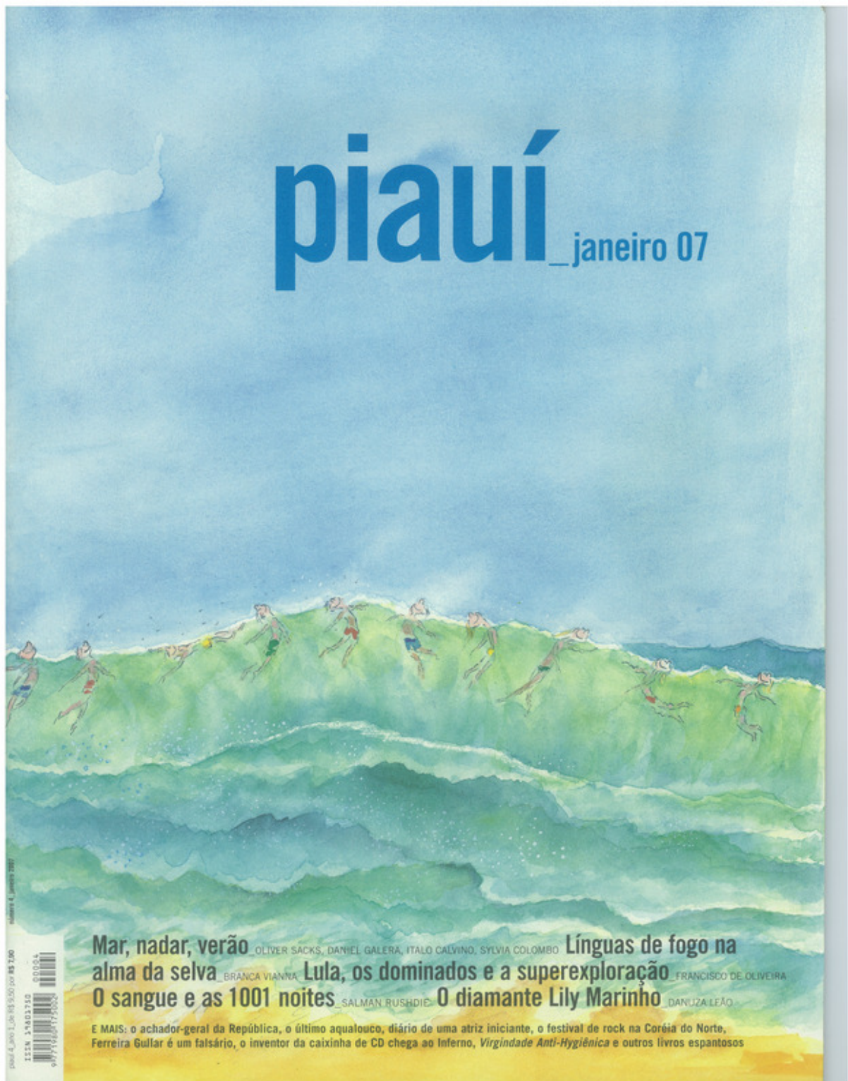
Figura A.4: capa da revista piauí de janeiro de 2007