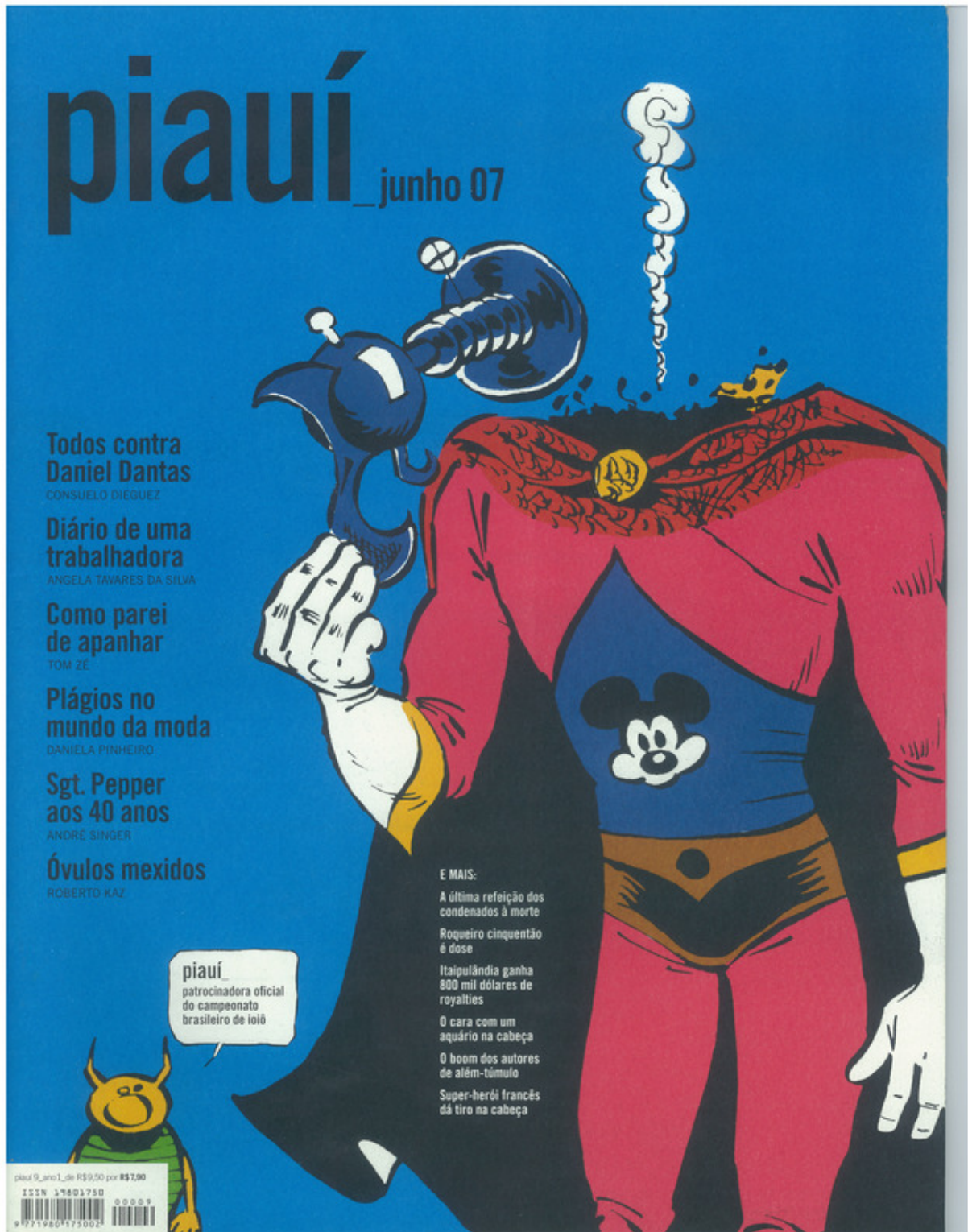
Figura A.9: capa da revista piauí de junho de 2007