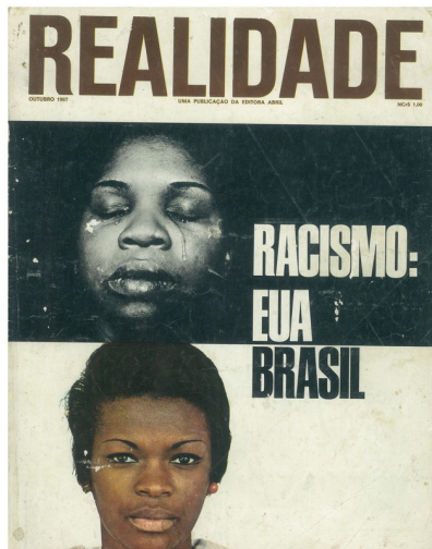
Figura 4.2: revista Realidade

Em processo de expansão e modernização, a Abril tinha como homem forte do jornalismo Roberto Civita, o segundo filho de Victor Civita, dono da editora. Depois da implantação de revistas de interesse segmentado, como Quatro Rodas , Manequim e Claudia , Roberto Civita fundou Realidade como o primeiro de dois projetos destinados a estabelecer o jornalismo da empresa entre os melhores do país – o segundo foi a Veja , lançada em 1968.