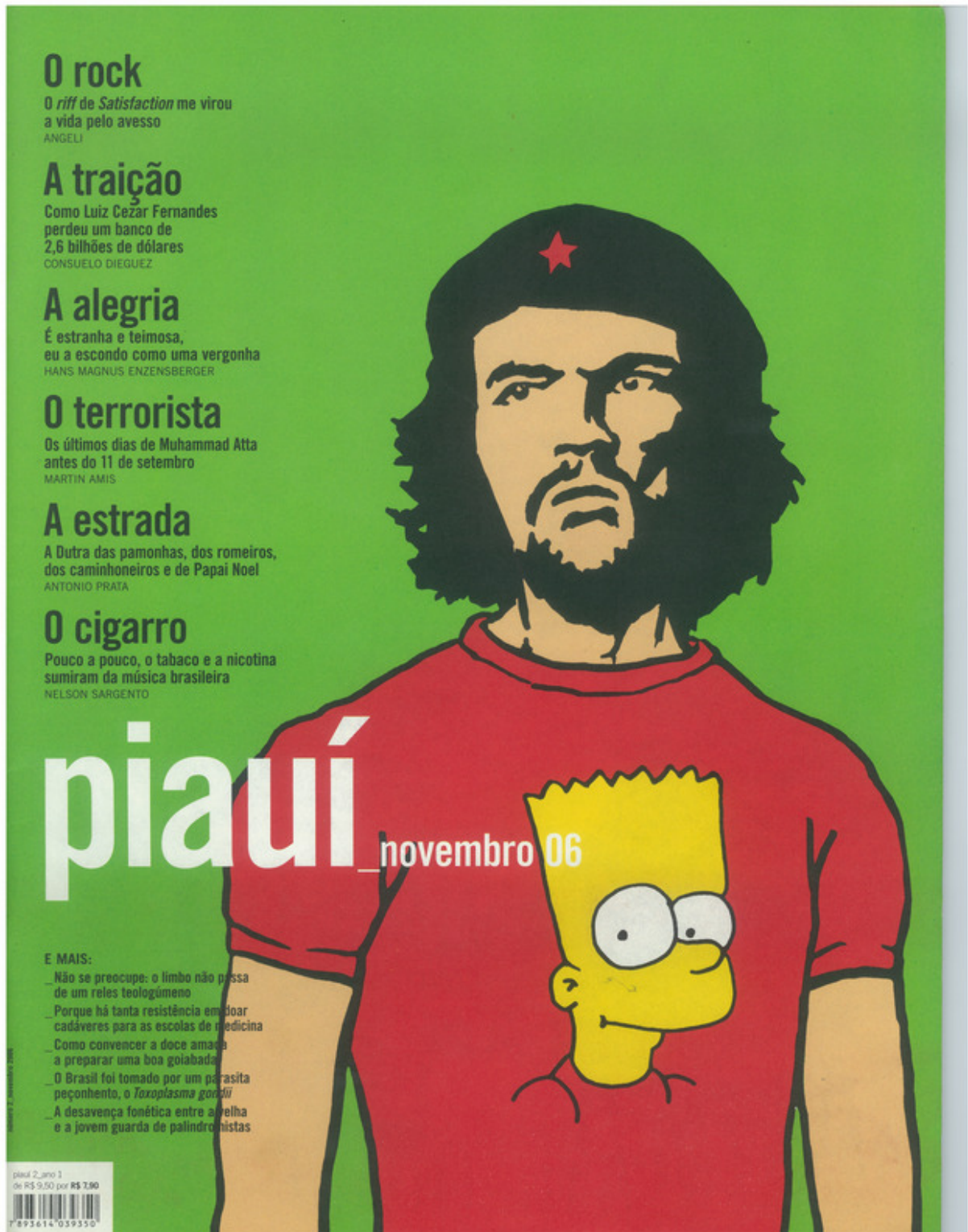
Figura A.2: capa da revista piauí de novembro de 2006