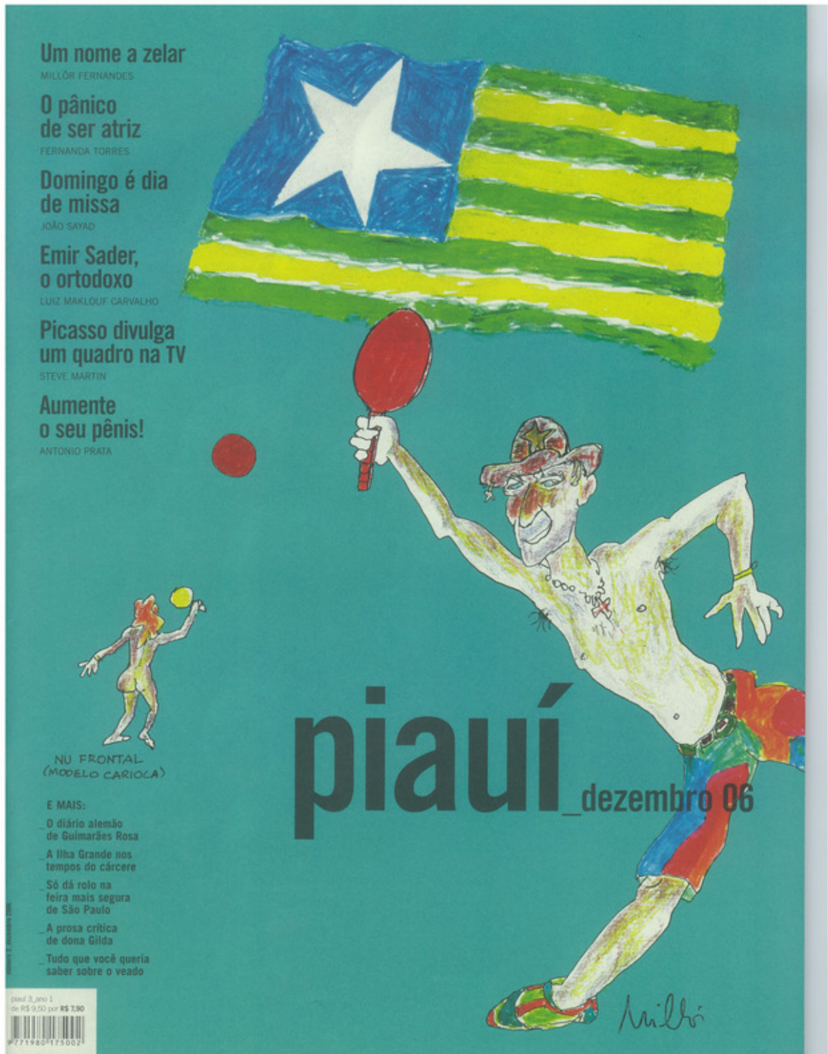
Figura A.3: capa da revista piauí de dezembro de 2006