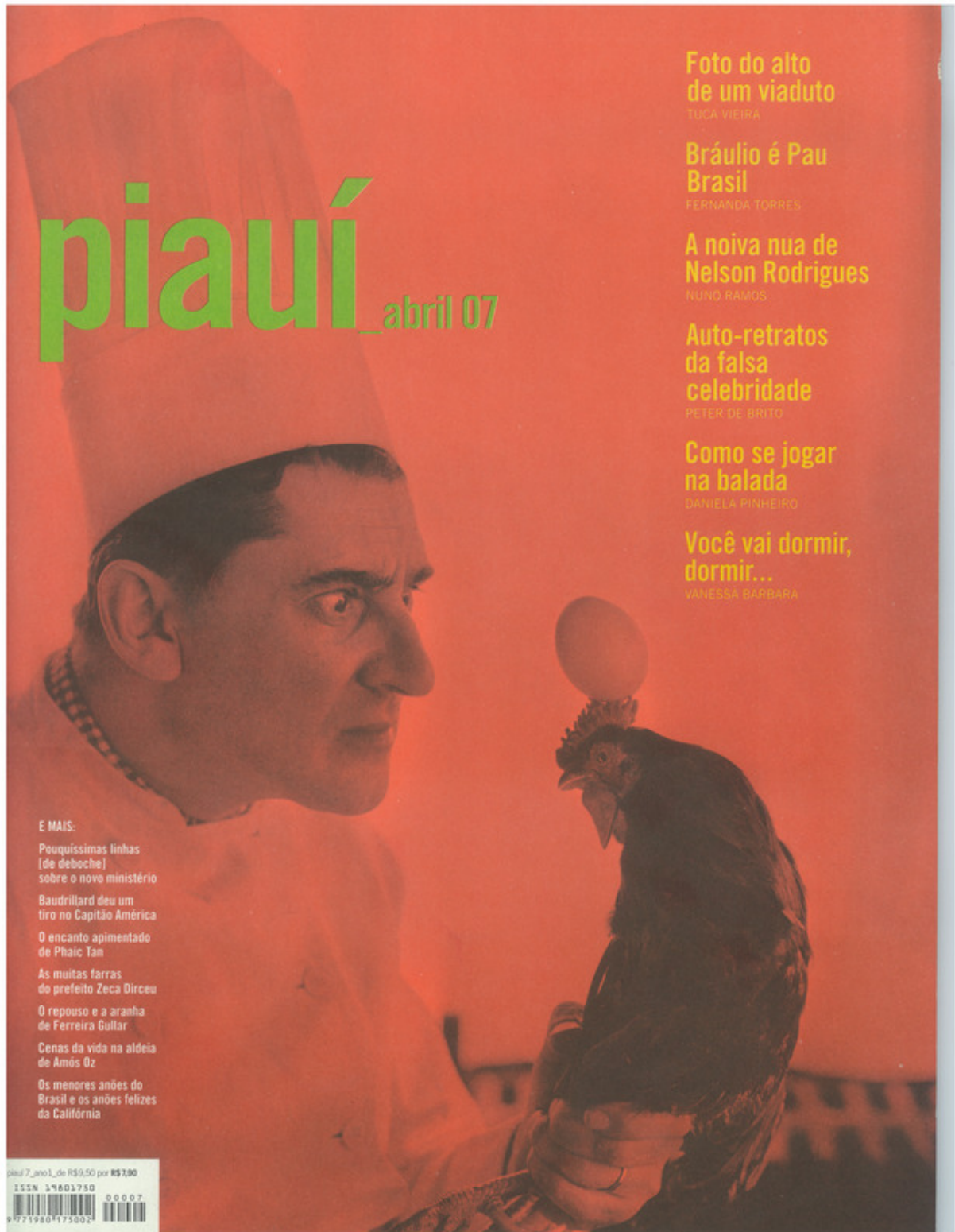
Figura A.7: capa da revista piouí de abril de 2007