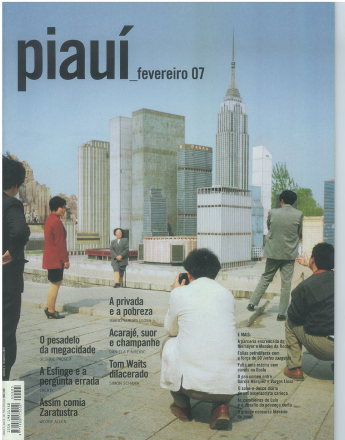
Figura A.5: capa da revista piauí de fevereiro de 2007