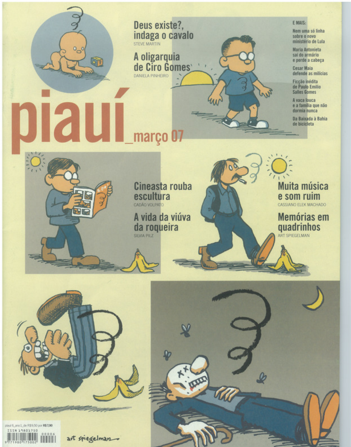
Figura A.6: capa da revista piauí de março de 2007